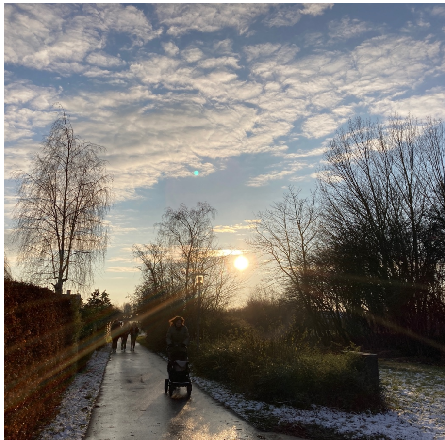
Fig. 8: Beboerne i det eksisterende Køge Nord er engagerede i deres lokalområde og bruger de muligheder, der på stedte aktivt.