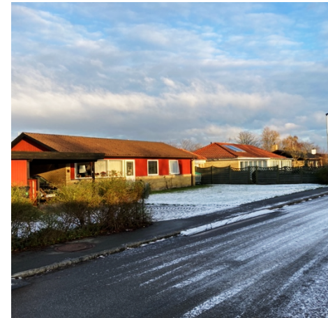
Fig. 3: Stemningsbilleder fra Køge Nord.

Øverst: Nettos centrallager, STC; Gravhøjen Nordhøj. I midten øverst Udsigt fra gangbro mod middelalderlandsbyen Ølsemagle; Gammel firlænget gård i Ølsemagle I midten nederst: Den nye Køge Nord station. Villavej Nederst: Boligblokke; Strandeng ned imod Køge Bugt.