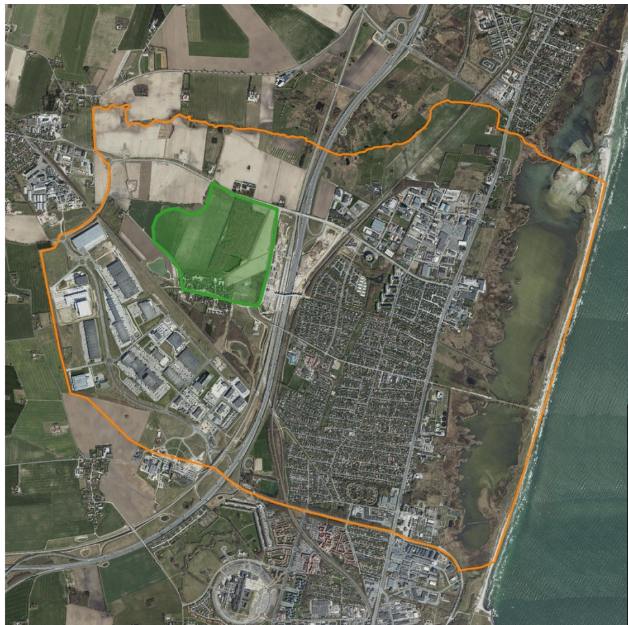
Fig. 1: Oversigtskort over nye og gamle Køge Nord. Afgrænsningen af det område, der kaldes Køge Nord er markeret med orange. Den nye bydel er markeret med grønt. Bemærk Køge Bugt motorvejen, som danner en fysisk barriere mellem det nye og det eksisterende Køge Nord.

En udfordring for bydelsprojektet er dog, at landskab og bebyggelse gennemgår en total forandring, bl.a. med opførelse af en langstrakt bakkekam i et ellers fladt landskab, opløsning af den eksisterende middelalderlandsby og plantning af skov i et historisk set åbent landbrugslandskab. Omlægningerne kommer til at bryde de eksisterende strukturer og fortællinger på stedet og fjerner den umiddelbare historiske dybde på stedet. Hvis ikke den historiske forbindelse gentænkes og genetableres, risikerer det nyetablerede landskab og nybyggeri – modsat hensigten – at fremstå identitetsløst og fremmedgørende (Böss 2014). Så hvordan sikrer man sig, at forbindelsen til historien på stedet genetableres, når folk begynder at flytte ind?