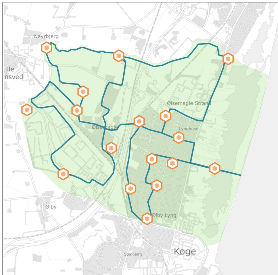
Fig. 2: Kort med forslag til rute for Tidslinjen (blå) og stoppesteder (orange). Med lys grøn er Køge Nord området markeret.

Et bud på hvordan den arkæologiske viden kan anvendes til at løse udfordringerne i Køge Nord er vandreruten Tidslinjen (fig. 2).