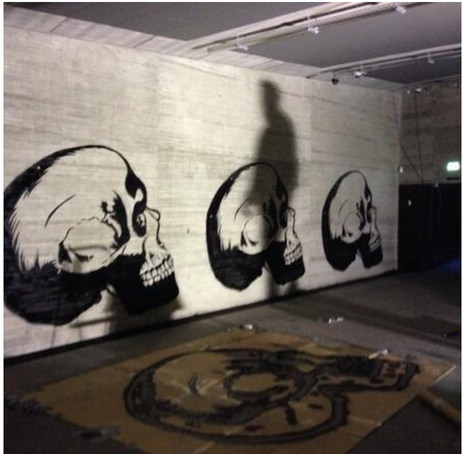
Fig. 5: Inspirationsfoto. Grafittikunst på Danmarks Borgcenter (en del af Museum Sydøstdanmark).

Målet med Tidslinjen er at binde de to boligområder i Køge Nord sammen: Fysisk gennem den konkrete bevægelse på ruten; socialt gennem fysiske mødesteder i det offentlige rum; oplevelsesmæssigt gennem mulighed for at opleve hele kvarteret i dets mangfoldighed; og endelig forståelsesmæssigt gennem at skabe et nært og aktivt forhold til stedets historie og derved forbinde nyt og gammelt i mere end én forstand på tværs af Køge Nord.