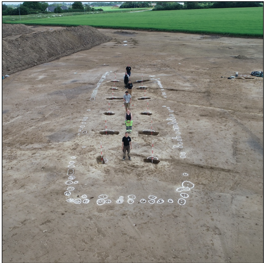
Fig. 6: Foto fra tidligere udgravning i Køge Nord. Med hvidt er stolpehullerne af et stort hus fra ældre romersk jernalder markeret. Husets størrelse og arkitektur giver anledning til overvejelser om sociale forskelle i ældre jernalders samfund.