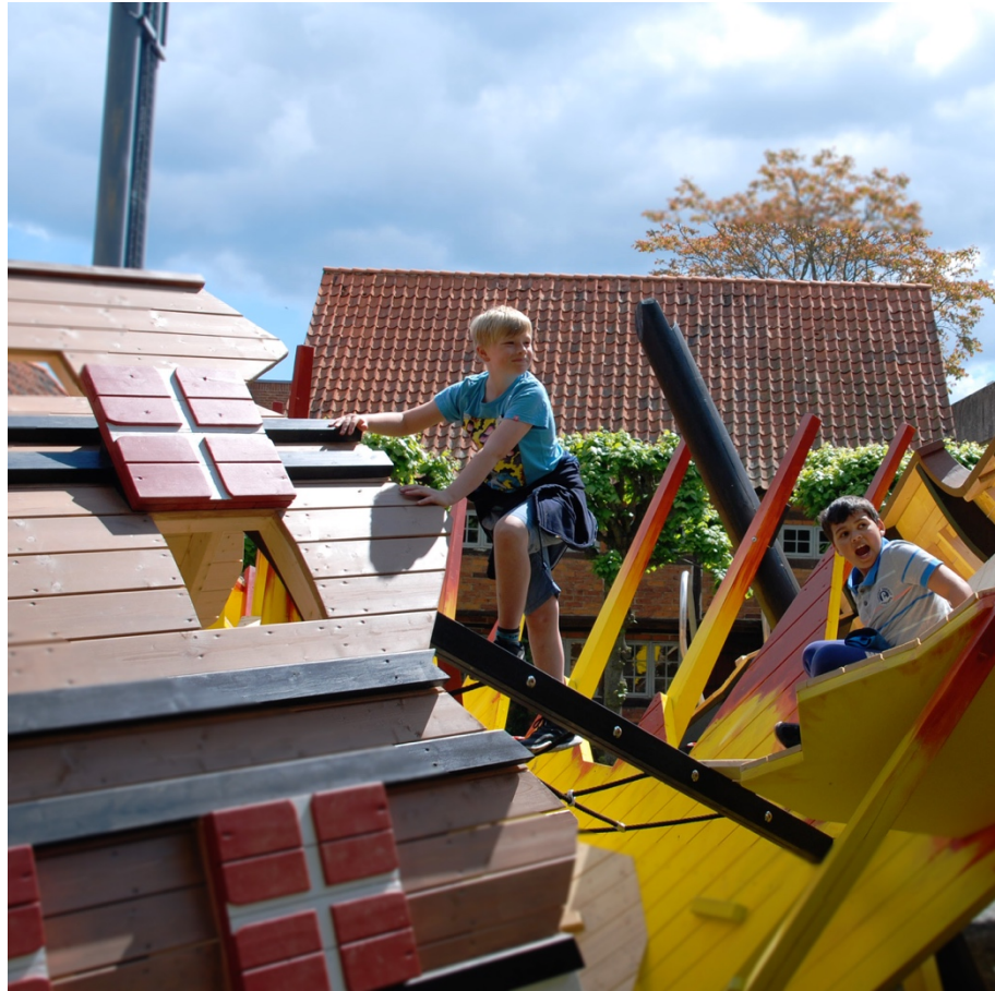
Fig. 4: Inspirationsfoto. Legeplads ved Køge Museum (en del af Museum Syddøstdanmark).

Legepladsen er udformet med inspiration fra vraget Dannebrog og formidler Slaget ved Køge Bugt gennem leg og aktivitet.