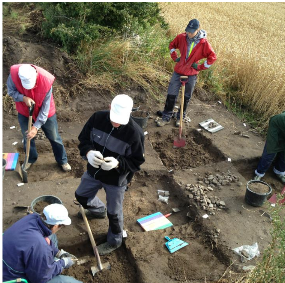
Fig. 7: Frivillige deltagere i udgravning af kvadratmeterfelter ved Strøby Toftegård, Stevns. Museet har generelt god erfaring med at involvere frivillige i de arkæologiske udgravninger og oplever stor interesse for at være med.